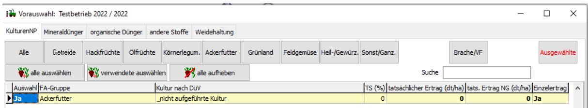
Abb.1: Vorauswahl: standardmäßige Auswahl „ nicht aufgeführte Kultur “