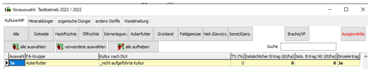
Abb.1: Vorauswahl: standardmäßige Auswahl „_nicht aufgeführte Kultur“